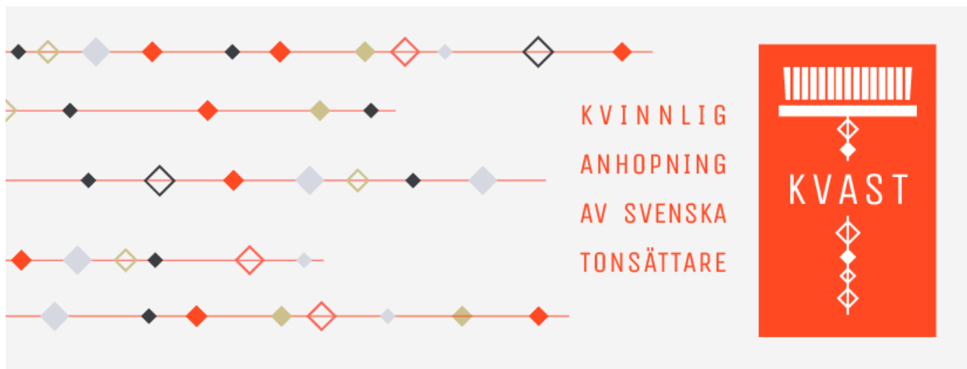
Nya loggan och visuella profilen.