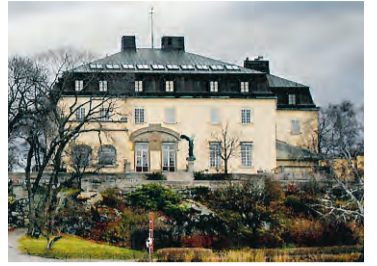
Waldemars udde.

Ifjol slog stiftelsen för Prins Eugens Waldemars udde larm om kommande förfall, samtidigt som man stoppade kapitaluttaget från den urholkade fonden. Regeringen har dock tillsatt nya ledamöter i stiftelsen, och i ett färskt beslut föreslår stiftelsen att 90 procent av avkastningen ska få gå till drift, så som prinsen en gång ville. Enligt överintendent Elsebeth Welander-Berggren behövs ändå ett statligt extraanslag om 3–4 miljoner kronor per år. JOHAN HELLEKANT